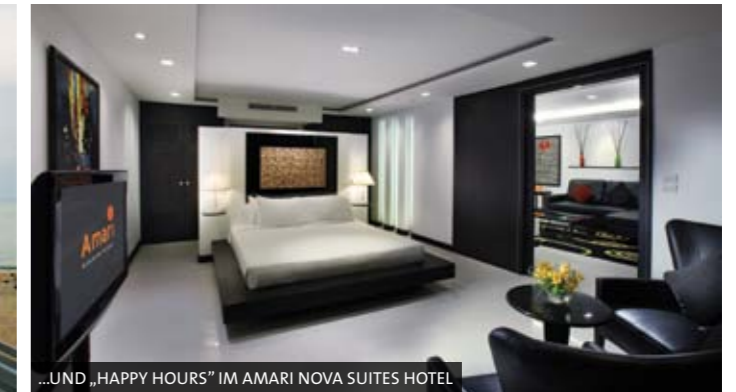
...UND „HAPPY HOURS“ IM AMARI NOVA SUITES HOTEL