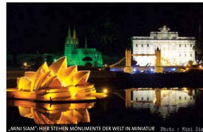
„MINI SIAM“: HIER STEHEN MONUMENTE DER WELT IN MINIATUR