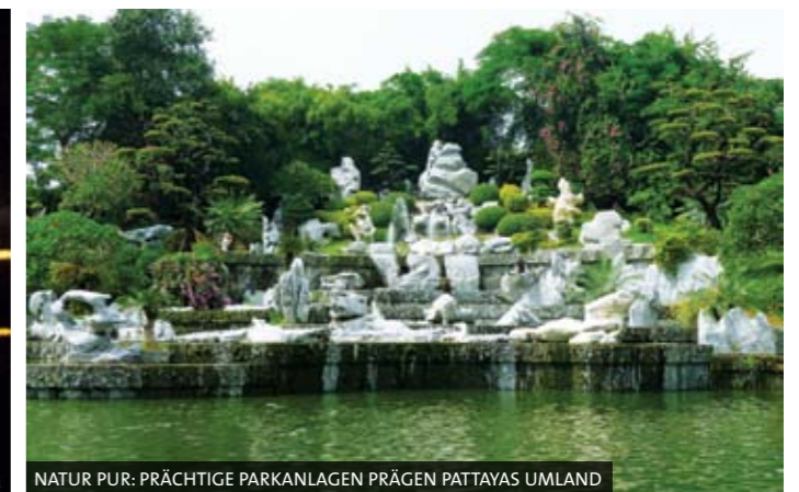
NATUR PUR: PRÄCHTIGE PARKANLAGEN PRÄGEN PATTAYAS UMLAND