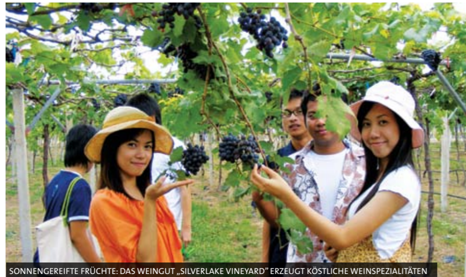
SONNENGEREIFTE FRÜCHTE: DAS WEINGUT „SILVERLAKE VINEYARD“ ERZEUGT KÖSTLICHE WEINSPEZIALTÄTEN

Als im Juni 1959 amerikanische GIs in einer Bucht im östlichen Golf von Thailand ankerten, um sich eine Woche lang vom Trauma des Vietnamkrieges zu erholen, fanden sie ein Paradies auf Erden: endlose Sandstrände, verschlafene Fischerdörfer, idyllische Bambushütten und bildschöne Töchter von lächelnden Thais. Schnell sprach sich bei den US-Soldaten herum, dass ein zauberhaftes Fleckchen Erde mit dem luftigen Namen Pattaya existiere, was so viel bedeutet wie „Seebrise“.