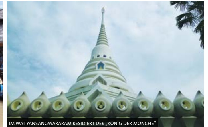
IM WAT YANSANGWARARAM RESIDIERT DER „KÖNIG DER MÖNCHER“