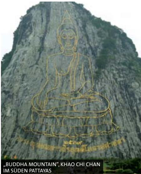
„BUDDHA MOUNTAIN“, KHAO CHI CHAN IM SÜDEN PATTAYAS

Sie wird geliebt oder verachtet. Sie ist keine Schönheit und hat einen zweifelhaften Sex-Appeal. Doch wer die berühmt-berüchtigte Stadt am Meer noch nie besucht hat, sollte nicht vorschnell urteilen. THAIZEIT ließ sich von den Sonnenseiten Pattayas verführen. Text und Fotos: Nathalie Gütermann