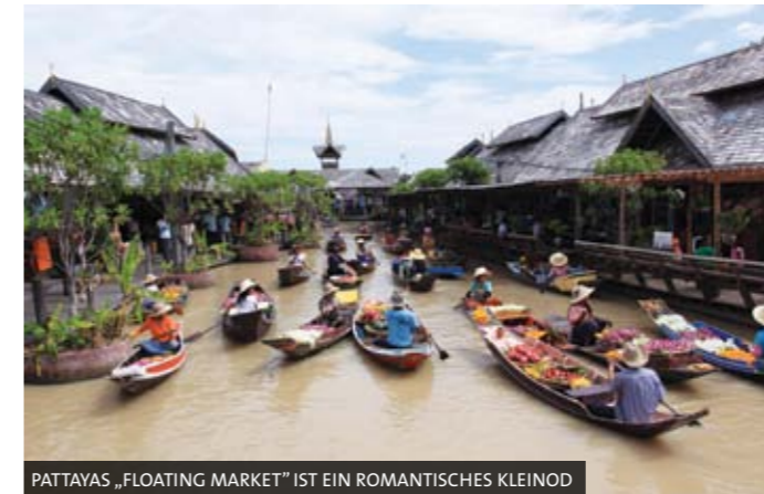
PATTAYAS „FLOATING MARKET“ IST EIN ROMANTISCHES KLEINOD