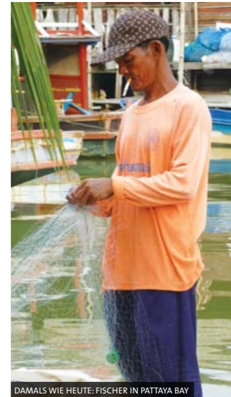
DAMALS WIE HEUTE: FISCHER IN PATTAYA BAY