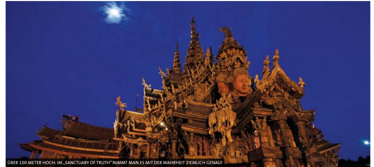
ÜBER 100 METER HOCH: IM „SANCTUARY OF TRUTH“ NIMMT MAN ES MIT DER WAHRHEIT ZIEMLICH GENAU!